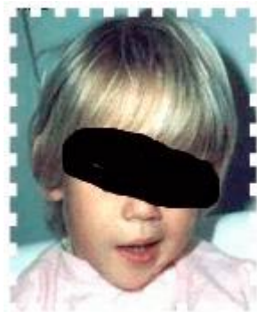
Figure 5 Paralysie faciale ( http://www.labodia.com/fr/lyme/review_fr/clinical_aspects_en.htm#lymphadenosis )