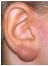
Figure 4 Lymphocytome cutané bénin ( http://www.labodia.com/fr/lyme/review_fr/clinical_aspects_en.htm#lymphadenosis )

Un lymphocytome cutané bénin peut également survenir à ce stade. Il s'agit d'une petite lésion saillante de la peau (nodule) de 1 à 2 cm de diamètre et rouge-violacé siégeant principalement sur le lobe de l'oreille ( Figure 4 ), le mamelon, le scrotum.